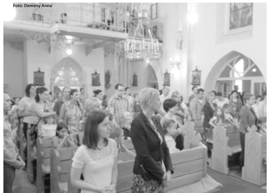
Fotó: Demény Anna