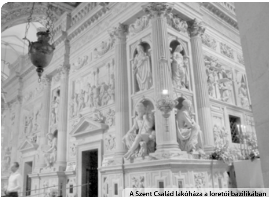
A Szent Család lakóháza a loretoi bazilikában

Uram, irgalmazz nekünk! – Uram, irgalmazz nekünk! Krisztus, kegyelmezz nekünk! – Krisztus kegyelmezz nekünk! Uram, irgalmazz nekünk! – Uram, irgalmazz nekünk! Krisztus, hallgass minket! – Krisztus, hallgass minket! Krisztus, hallgass meg minket! – Krisztus hallgass meg minket! Mennybéli Atyaisten! – Irgalmazz nekünk! Megváltó Fiúisten! – Irgalmazz nekünk! Szentlélek Úristen! – Irgalmazz nekünk! Szentháromság egy Isten! – Irgalmazz nekünk! (...)