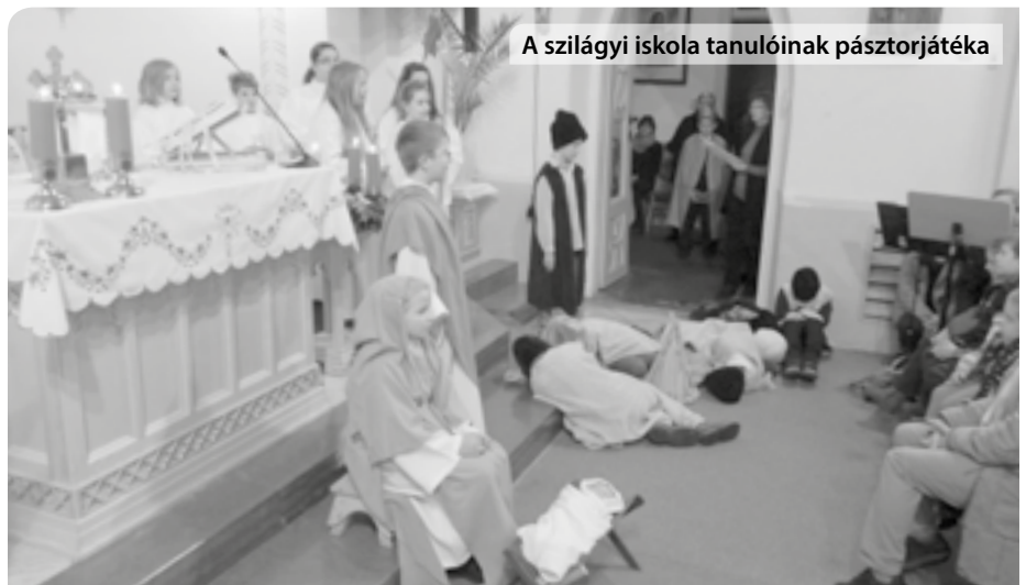
A szilágyi iskola tanulóinak pásztorjátéka