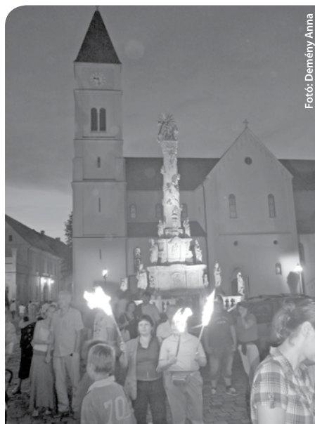
Fotó: Demény Anna