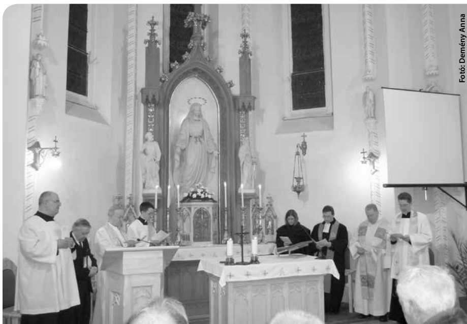
Fotó: Demény Anna

Írta és szerkesztette: Demény Anna Forrás: Internet