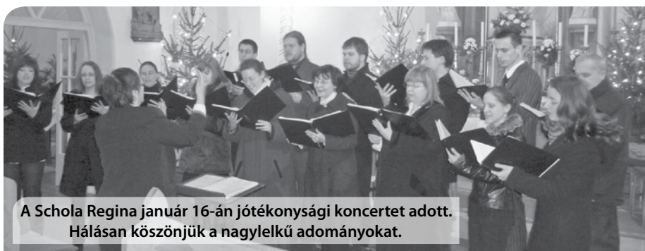
A Schola Regina január 16-án jótékonyági koncertet adott. Hálásan köszönjük a nagylelkű adományokat.