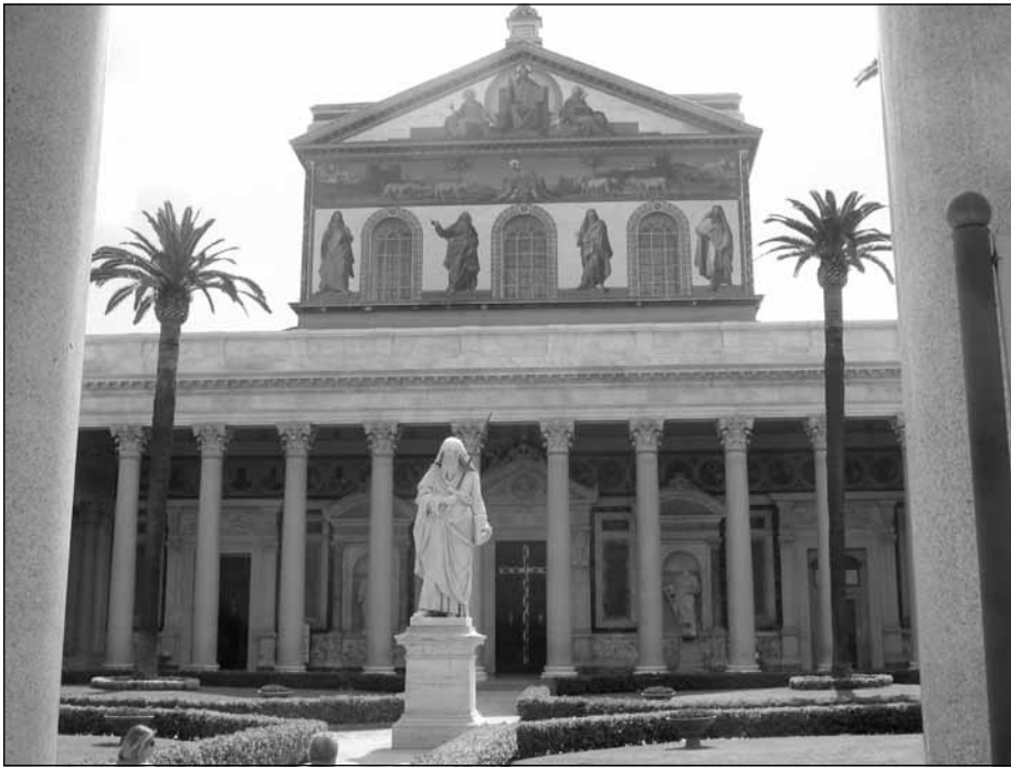
Szent Pál-bazilika az apostol szobrával, Róma

az megy be a mennyországba, aki azt mondja: „Uram, Uram!”, hanem az, aki Krisztus törvényeinek szellemében cselekszik. Szent Pál leveleiből is egyértelműen kiderül ez.