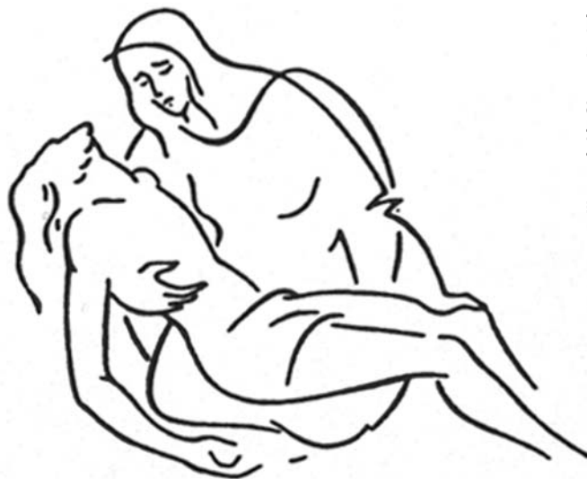
Illusztráció: Simon András